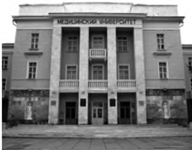
С праздником Вас, дорогие друзья! Успехов Вам на пути к вершинам знаний!

Наш Башкортостан всегда славится своим высоким интеллектуальным потенциалом. Мы искренне верим, что нынешняя молодежь приумножит славные традиции, позволит гордиться ее достижениями.